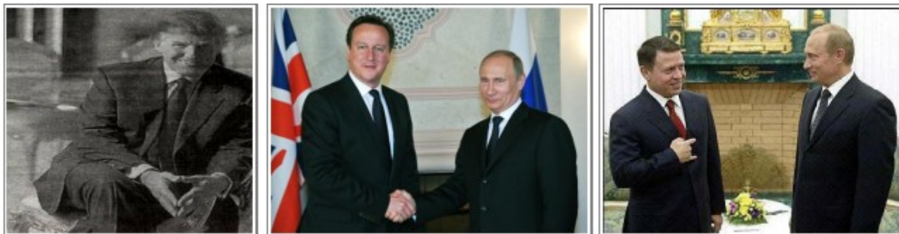
Från vänster: Den falske presidentkandidaten Trump gör pyramidtecknet. Storbritanniens premiärminister Cameron möter Putin i frimurarhälsning. Jordaniens kung Abdullah gör Lucifertecknet inför en flinande Putin .