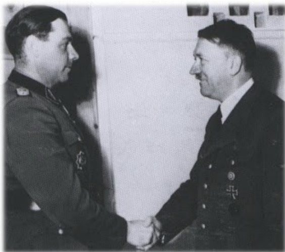
Adolf Hitler var precis som Roosevelt, Churchill och Stalin frimurare.

När du skakar hand , sträcker sig tummen naturligt uppåt eller rakt fram. När den pekar nedåt, signalerar du medlemskap i världens största sataniska kult, Frimureriet, och att du förbundit dig till dess mål om en världsregering under antikrist.