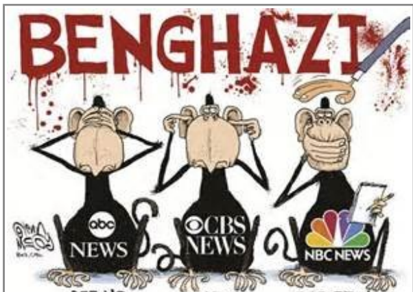
De tre visa aporna illustrerande USA-medias hållning relativt Hittlarys ansvar för Bengazi-skandalen.

Här är (länken till) en BBC-video där USA:s förre finansminister Henry Paulson, gör frimurarnas tecken 'trianglering' (en pyramid med fingrarna), cirka 3.20 min in i videon. Paulson lyckades höja stats-skulden till $ 11 biljoner år 2008. Under Illuminatimedlemmen George W. Bush tid som USA-president, fördubblades statskulden! Han spenderade lika mycket (pengar) som varje (USA)-administration före honom honom. Obama har ökat på den till $ 20 biljoner. (Genom detta) har de gjort mer för att förslava amerikaner genom en fiktiv (stats)skuld än någon annan president. Kom ihåg att varje ny dollar i 'skuld' är en dollar i centralbankirernas fickor.