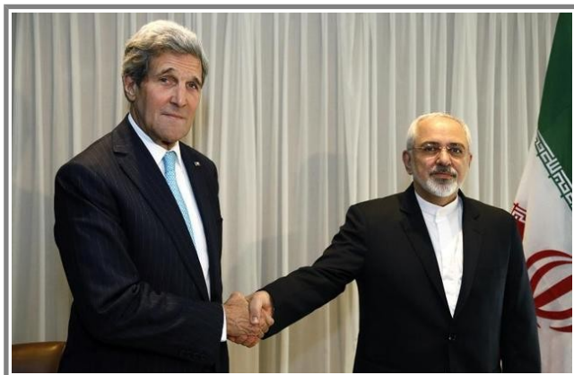
Bilden: Den iranske utrikesministern Mohammad Javad Zarif (höger) i samtal med USA:s utrikesminister John Kerry i Genève, den 14 januari 2015. Uppenbarligen är konflikten Iran-USA ett låtsasspel.

Tydligen motsätter sig Lucifer-tillbedjare som Maher varje sak som gör människor oberoende av deras tyranni. Det är bra att vara tolerant gentemot homosexualitet och pornografi, men inte (mot) Guds ande som hjälper människor att skilja (mellan) rätt och fel.