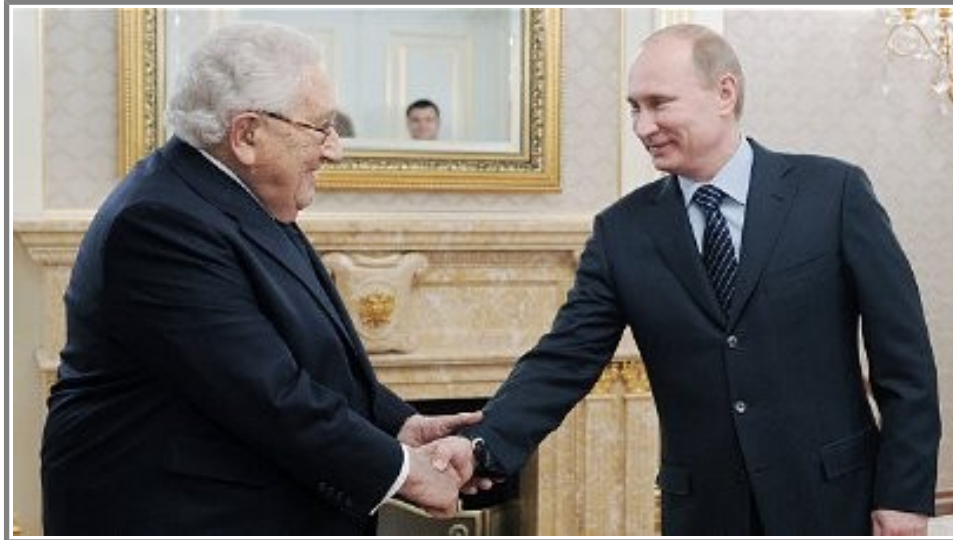
Kissinger och Putin möts i ett frimurarhandslag (Fler bilder längre ned i artikeln).