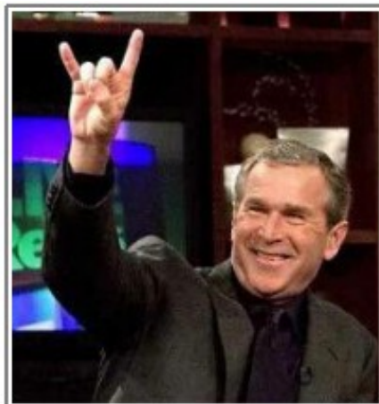
Henry Paulson gör frimurarnas pyramid, medan President George Bush signalerar Lucifers hornstecken.